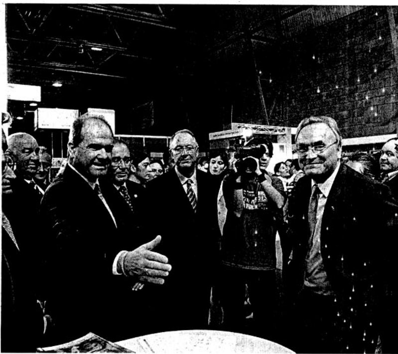
INAUGURACIÓN. Momento de la inauguración de la feria, ayer en Aguadulce.