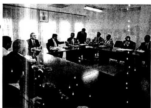
INICIATIVA. Sede de la Fundación Mediterránea.