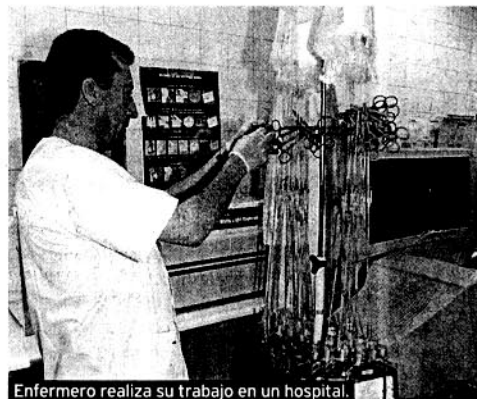
Enfermero realiza su trabajo en un hospital.