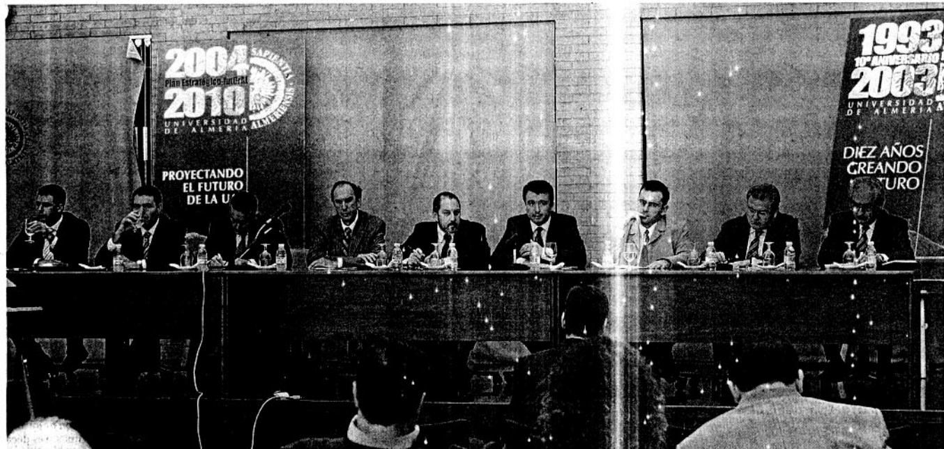
MESA. Empresarios y asociaciones empresariales debaten sobre el Plan Estratégico en la Sala Bioclimática.