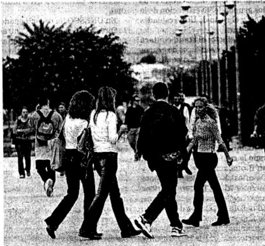
CAMPUS. Universidad de Almería.

Además, en la reunión se destacó la «profunda preocupación» por que los decretos que está elaborando y tramitando el Ministerio de Educación, Cultura y Deporte impidan, en la práctica, llevar a cabo estos compromisos.