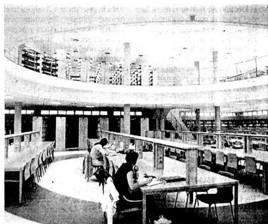
NOVEDAD. Instalaciones de la nueva biblioteca.