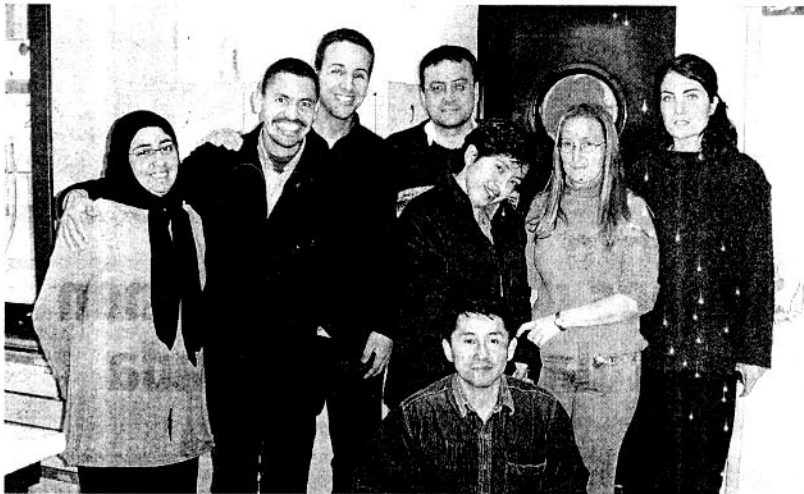
EXPERTOS. Algunos de los miembros del grupo.

También mantienen otros contactos internacionales, como con la Universidad de Florencia, Universidad de York, Toulouse, y otras Alemanas.