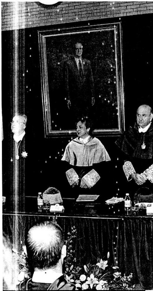
CONSEJERA. Cándida Martínez en una visita a la UAL.

Desde una óptica que valore la congruencia entre el ser y el querer ser, las fortalezas y debilidades de nuestra realidad actual y nuestra capacidad de incidencia en el mejoramiento de las condiciones en que se desenvuelve la sociedad en que nos insertamos, así como continuar con esa extraordinaria labor del Rector y Equipo de Gobierno de incidir de manera positiva en el entorno social, y que representa una oportunidad de apertura que permite proyectar las virtudes de nuestro modelo educativo y estrechar vínculos.