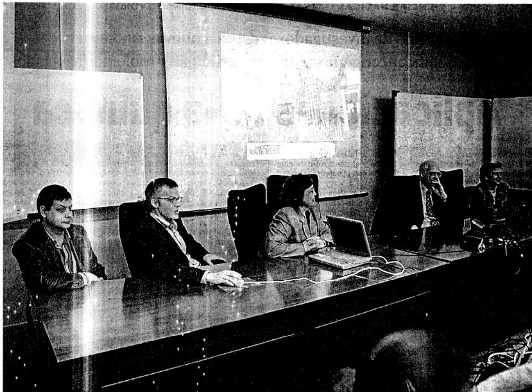
PROTAGONISTAS. Alumnos almerienses participantes en el programa explican su experiencia en la UAL.