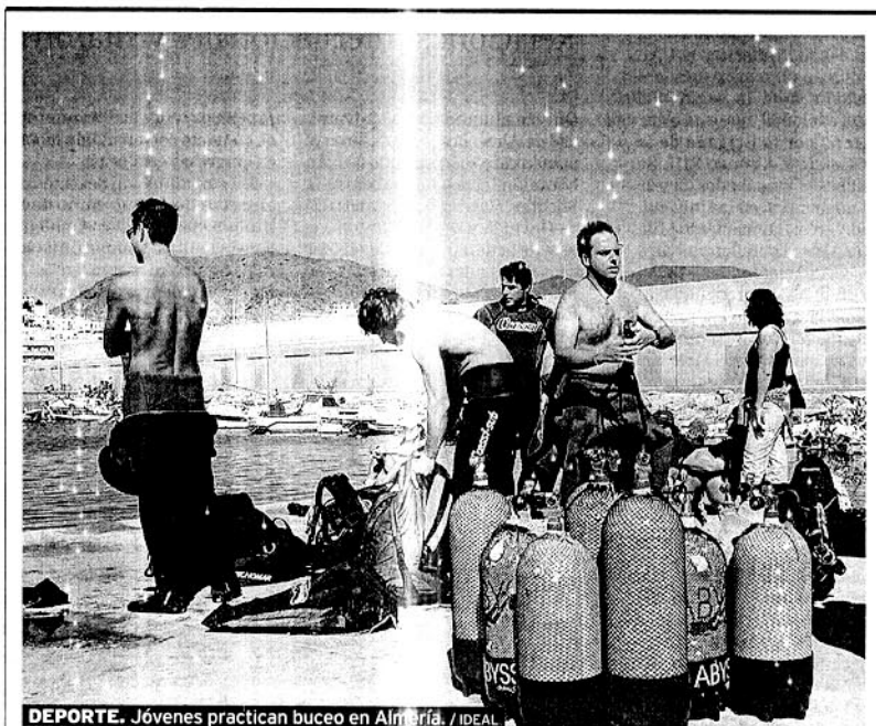
DEPORTE. Jóvenes practican buceo en Almería.