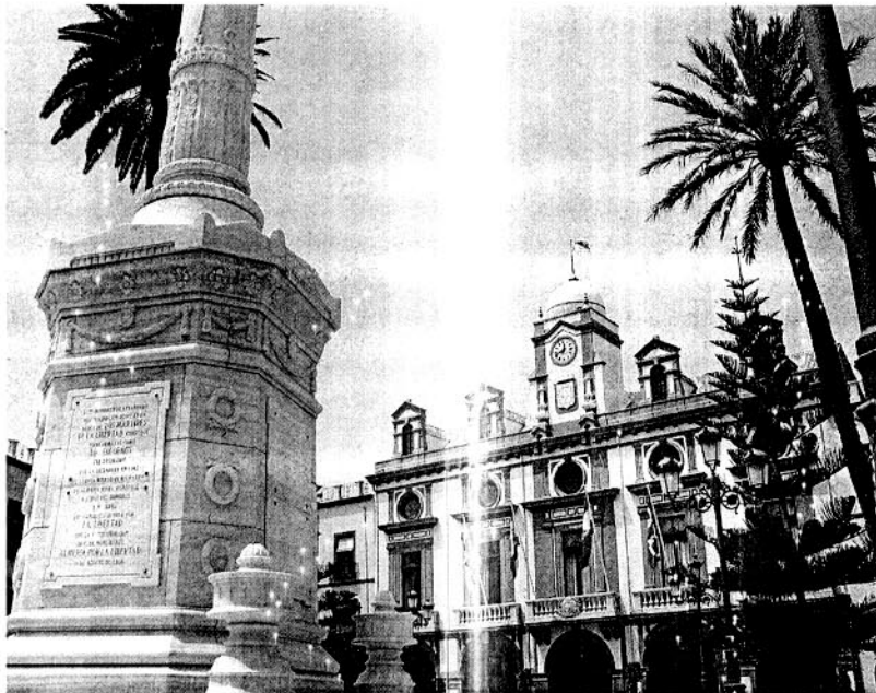
AYUNTAMIENTO. Edificio de la Casa Consistorial de Almería.