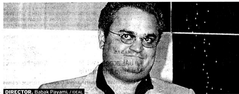
DIRECTOR. Babak Payami. / IDEAL

Con el objetivo de establecer un debate con la sociedad almeriense para que ésta participe en la elaboración del Plan Estratégico de la UAL, se están celebrando una serie de mesas redondas con diferentes colectivos de Almería. En total, son cuatro mesas que se han desarrollado en estos días.