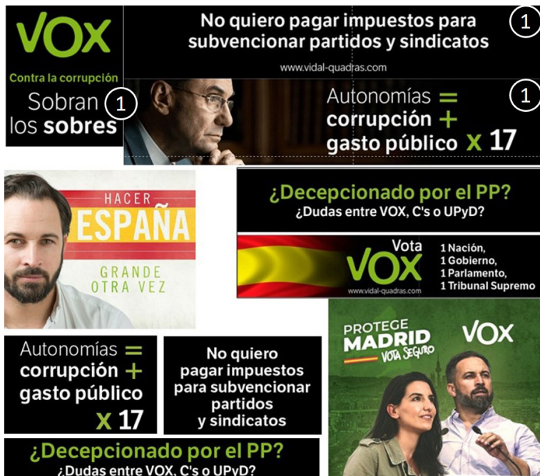
Figura 1. Ejemplos de piezas con temáticas: Gasto público, Autonomías, Delincuencia/Seguridad y patriotismo, Antagonismo contra el statu quo y Corrupción